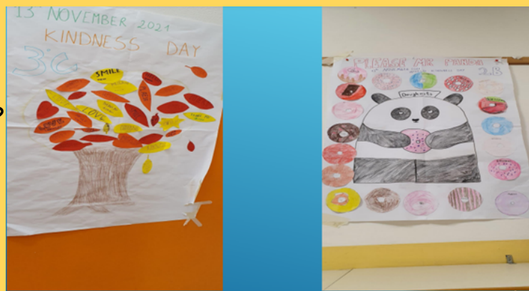
Kindness day: giornata della gentilezza